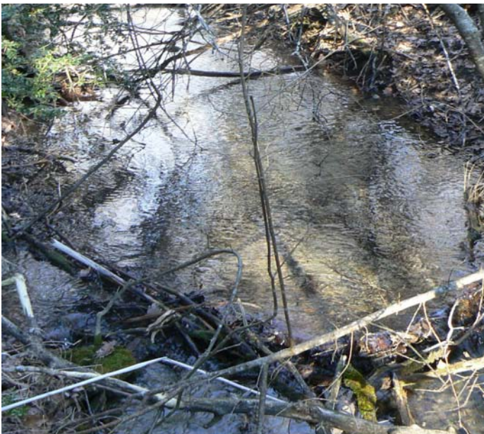
Encombrement du cours de l'adoux de la Garenne 1