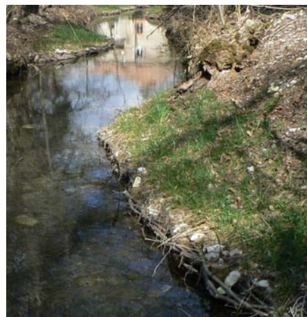
Fascines en amont