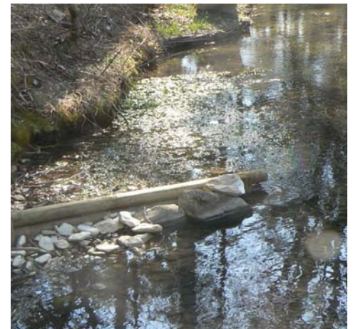
Epi défecteur en amont