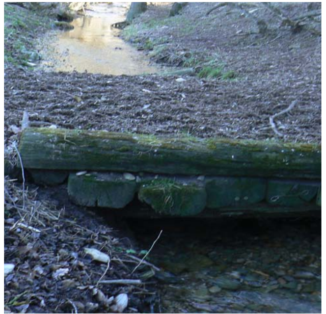
Berges piétinées à renforcer