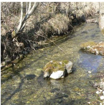
Cache à poissons

Les positionnements exacts des fascines, des épis défecteur et des caches à poissons, seront précisés lors de la réunion de démarrage du chantier et seront soumis à l'approbation des agents de l'ONEMA et de la Fédération de Pêche,