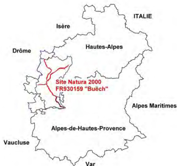
Figure 1: Localisation du site Natura 2000 "Le Buëch"

Le site Natura 2000 « Le Buëch » est situé sur les départements des Hautes-Alpes et des Alpes-de-Hautes-Provence, sur respectivement 87% et 13% de sa surface (cf. Figure 1).